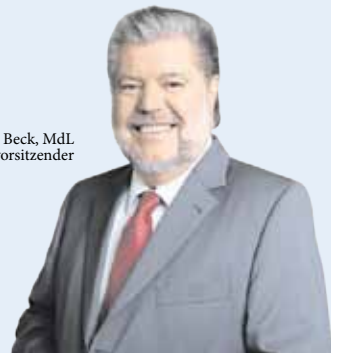
Kurt Beck, MdL SPD-Landesvorsitzender

„HERZLICHEN GLÜCKWUNSCH UND ALLES GUTE ZU 60 JAHREN BSV BEHINDERTEN- UND REHABILITATIONSSPORT- VERBAND RLP E.V.“