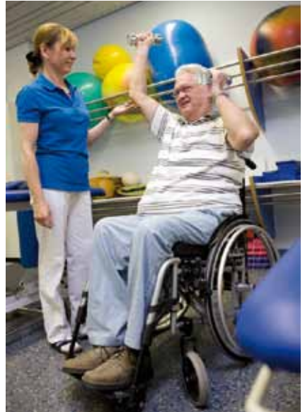
Sport spielt in der Rehabilitation eine besondere Rolle.

Die gesetzliche Unfallversicherung gewährleistet nach einem Unfall umfangreiche Leistungen, wie zum Beispiel individuelle Betreuung, Hilfsmittel, Krankenhaus- und Rehabilitationsaufenthalte, therapeutische Anwendungen wie auch sportliche Rehabilitationsmaßnahmen. „Als gesetzliche Unfallversicherung ist es unser Auftrag, die Gesundheit unserer Versicherten wieder herzustellen und zu fördern. Die Unfallkasse setzt sich dafür ein, nach einem Versicherungsfall mit allen geeigneten Mitteln den Gesundheitsschaden zu beseitigen, zu bessern